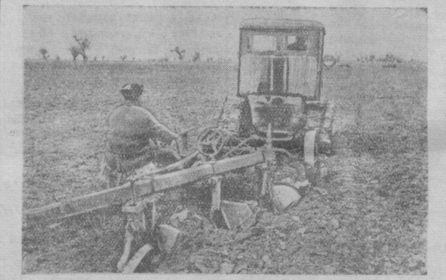
Обращение Верховного Совета Союза ССР ко всем народам страны подняло волну трудового энтузиазма среди хлопкоробов и механизаторов Свердловского района, Бухарской области. Одновременно с уборкой урожая в колхозах проводится очистка полей от гуза-пай и подъем зяби. В сельхозартели «Сталинград», например, все работы проводятся по конвейерному способу. На большой полях колхоза «Сталинград». На снимке: подъем зяби на

В принятой резолюции швейники горячо одобряют Декларацию и Манифест мира. Принято обязательство — до конца года дать сверх плана продукции на 5 миллионов рублей.