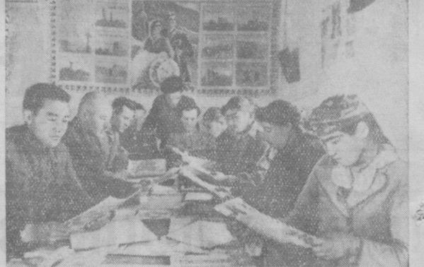
Сельхозартель имени Куйбышева, Пай-Арынского района, Самаркандской области, за последние два года из недлиных фондов израсходовала более 5 миллионов рублей на культурно-хозяйственное и бытовое строительство. Здесь построены десятки жилых домов для колхозников, клуб, помещения для животноводческой фермы и другие. На снимке: в читальне колхозного клуба.

Коллективы предприятий заводоуправления решили до конца года выработать продукции дополнительно к плану на восемь миллионов рублей.