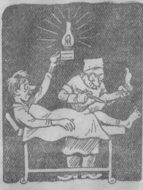
Рис. М. Воробейчикова.