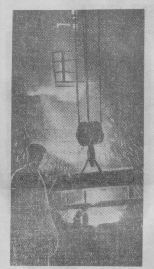
На снимке: разлив стали на заводе «Чирчиксельмаш».

В поселке возникают новые жилые постройки. Заложено еще 12 четырехквартирных домов. Строители обязуются сдать их к заселению в начале будущего года.