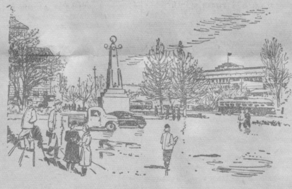
Ташкент. На улице Навои.

Участники конференции разработали мероприятия по внедрению новой техники и технологии, изучению и распространению передового опыта, усилению творческой мысли.