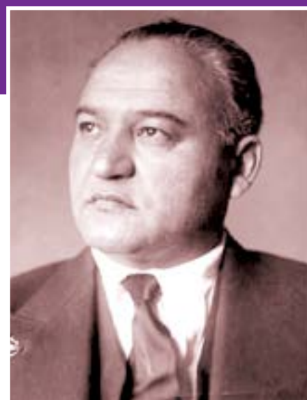
orzusi O‘zbekistonda opera san‘atini yaratish va shu operada bosh rollardan birini ijro etish edi”, deb yozadi...

esa “Yo‘qolsin bolsheviklar!” degan yashil tasmalarni osib, Qo‘qon va atrofdagi qishloqlarga borib, turkcha marshlar kuylab, aholini to‘plardi. Davraga hukumat vakillari yoki taniqli ulamolalar chiqib, muxtoriyatni qo‘llab-quvvatlash haqida ma‘ruzalar qildirdi. Yig‘inlar bayramona tus olar, “Yashasin muxtoriyat”, “Hamma hokimiyat muxtoriyatga!” shiorlari ostida xalqni bolsheviklarga qarshi qo‘lga qurul olishga da‘vat etish bilan tugardi. Afsuski, Turkiston muxtoriyati hali beshigidayoq bo‘lg‘izladi, istiqloq istagida yongan yuraklar tindi, orzular sarobga aylandi. Qizil askarlar tomonidan to‘pga tutilgan Qo‘qon bozorlari yondirildi, arman doshnoqlari qo‘li bilan “o‘liklar shahr”ga aylantirildi. Ko‘p o‘tmay bolsheviklar butun Farg‘ona vodiysini qonga botirdi.