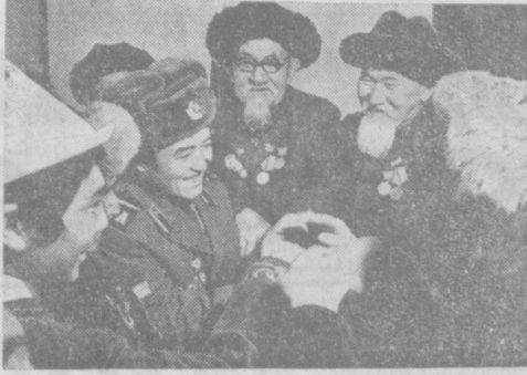
▲ ҚИРГИЗИСТОН ССР. «Қорақўли» колхозини Талас районидagi энг йirik чорвачилик...