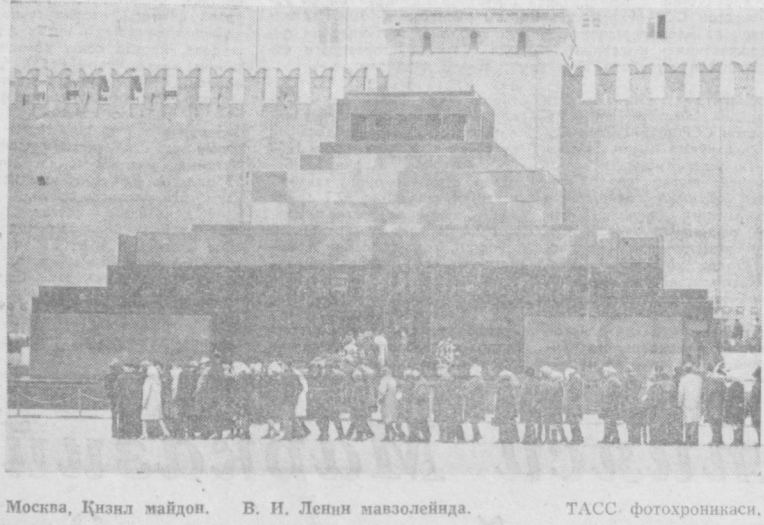
Москва, Қизил майдон. В. И. Ленин маъзолейида.

М. ТОШМАТОВ, область коммунал хўжалик бошқармаси обод-лаштириш бўлимининг бошлиғи.