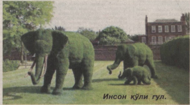
Инсон қўли гул.