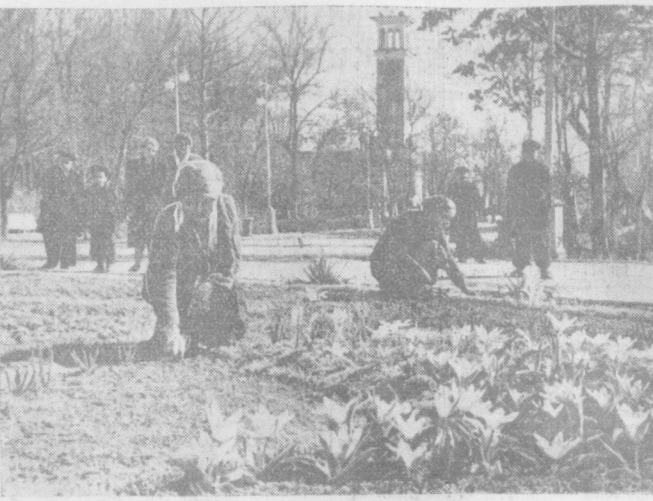
Маданият ва истироҳат паркларида, скверларда ёзги мавсумга қизгин тайёргарлик қўрилмақда. Суратда: Революция скверда гул кўчалари ўтказилмоқда.