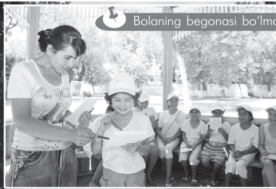
Bolaning begonasi bo'lmaydi