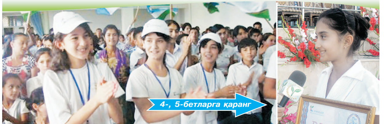
4-, 5-бетларга қаранг