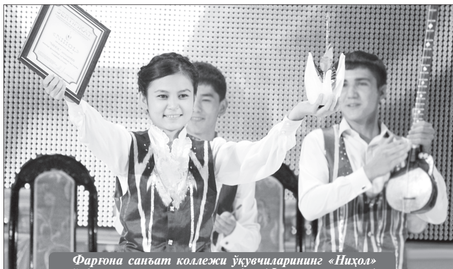
Фарғона санъат коллежи ўқувчиларининг «Ниҳол» ўзбек халқ чолгулари ансамбли (Фарғона вилояти)