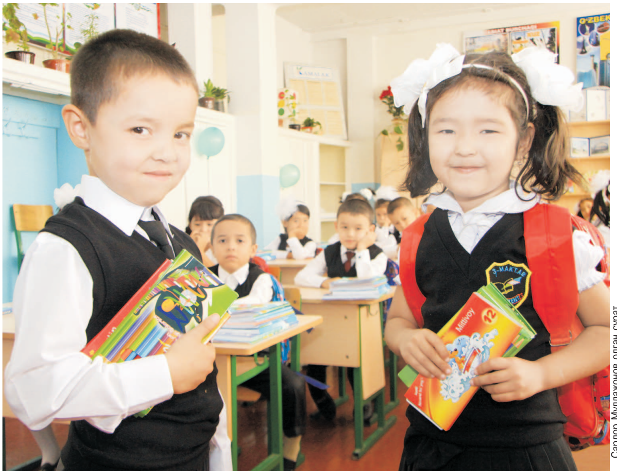
Бу йил 528 972 нафар бола юртимиздаги мактабларнинг 1-синфига қадам қўйди. Ука-сингилларимиз аънамага кўра, биринчи сабоқни «Мустақиллик дарси»да олишди. Шундан сўнг уларга ўн икки номдаги ўқув куроллари жамланмаси ва ўқув сумкасидан иборат Президент совғаси топширилди.