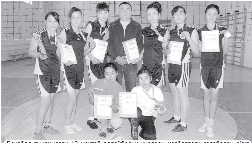
Бекобод туманидаги 13-мактаб волейболчи қизлари навбатдаги ғалабадан сўнг