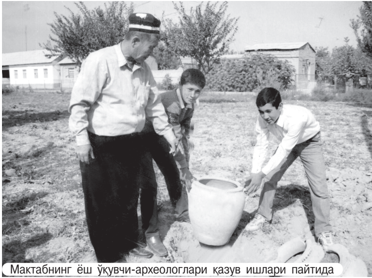
Мактабнинг ёш ўқувчи-археологлари қазув ишлари пайтида

Ўз бағрига 555 нафар ўқувчини, 56 нафар ўқитувчи ва мураббийни олган Бекобод туманидаги 13-мактаб Тошкент вилоятидаги илғор билим масканларидан бирidir. 450 ўринга мўлжалланган замонавий ўқув биноси 2009 йилда умуммиллий дастурга мувофиқ тўлиқ капитал реконструкция қилинди. Барча ўқув хоналари замон талаби даражасида жиҳозланган, компьютер, видеопроектор, телеаппаратуралардан унумли фойдаланилмоқда. Физика, кимё ва биология фанлари бўйича ўқув-лаборатория хоналари зарур техник анжомлар билан таъминланган. Замонавий спорт зали бор.