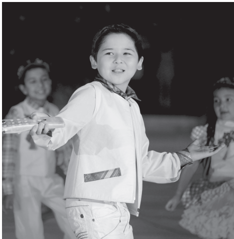
(Давоми, боши 1-бетда)

Ўйлаб қолсан, киши: бир-бирига мушт дўлайтираётган, қурол ўқталаётган, бир-бирининг тинчини бузаётган, ўзича таҳдид қилаётганлар ҳам одамларми? Одам бўлса, уларнинг ҳам бошқаларга ўхшаб ватани, ота-онаси, бола-чақаси, ака-укаси, опа-синглиси борми? Бор бўлса, уларни ўйлайдими? Бугун мен бировнинг уйини бузаяпман, эрта-бир кун бировлар меннинг уйимни бузишга уриниб кўрмайдими, деган фикр хаёлига бир бора бўлса ҳам келадими? Демократия ҳақида оғзидан тупук сачраб, лоф урган ҳар кас демократ, тинчлик ҳақида оғзини тўлдириб гапирганнинг ҳаммаси тинчликпарварми? Ана, дунёда, бир жойда сал нотинчлик ё беқарорликнинг иси чиқса, тинчитаман, деб найза кўтариб югургилаб қоладиганлар ҳам бор. Наники уларни шунақа ҳовлиқтирмаслик