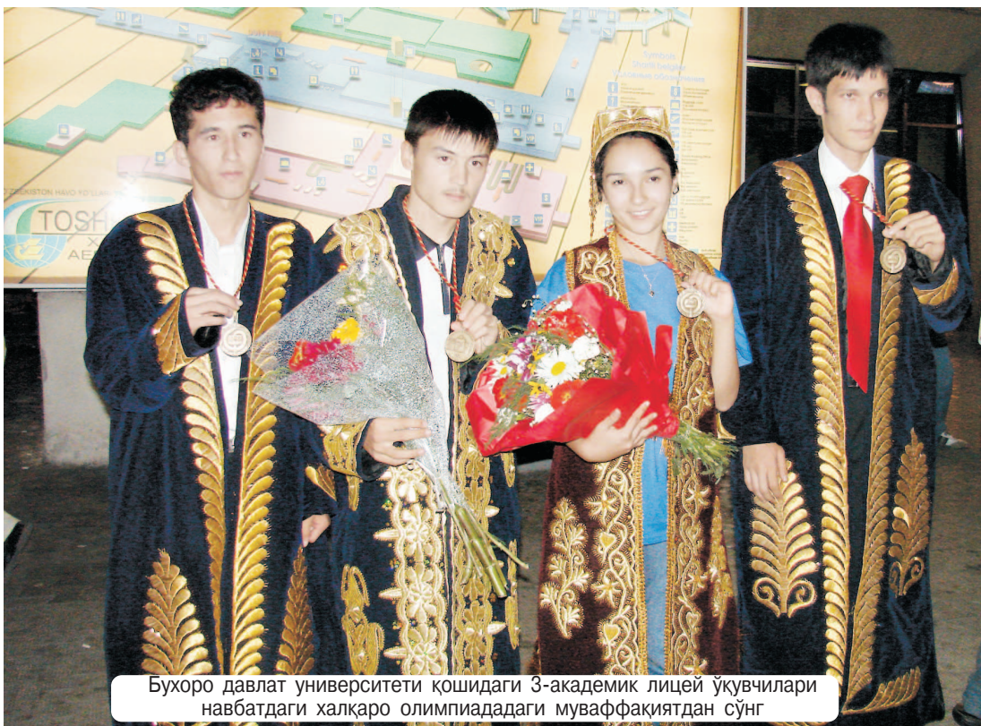
Бухоро давлат университети қошидаги 3-академик лицей ўқувчилари навбатдаги халқаро олимпиададаги муваффақиятдан сўнг