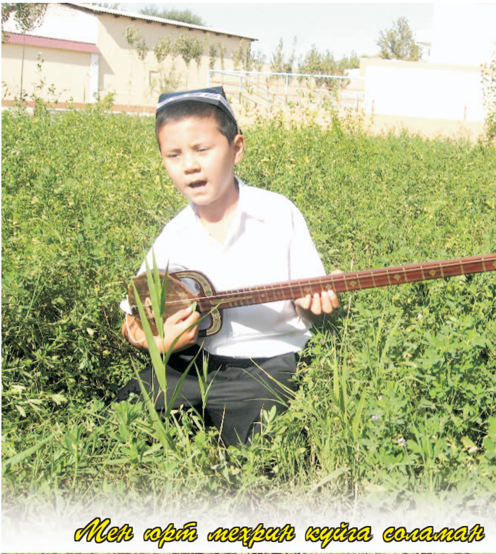
Мен юрт меҳрин куйга солганман

Ғофил тушунмагай ошиқ тилига, Мен кўнгил берганман гуллар гулига. Юз жоним юз попуқ юз кокилига, Юз жоним юз дорға илганман.