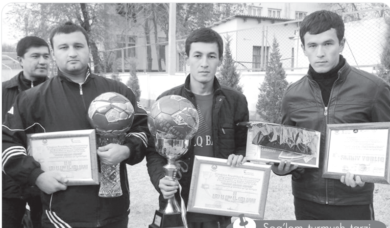
Sog'lom turmush tarzi