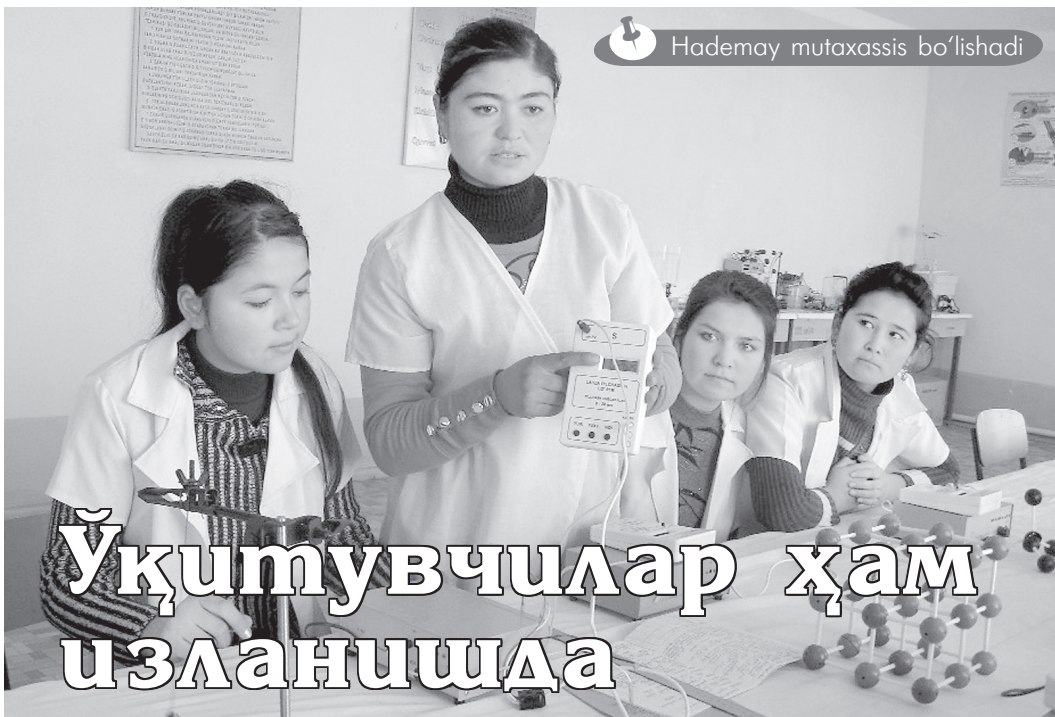
Hademay mutaxassis bo'lishadi