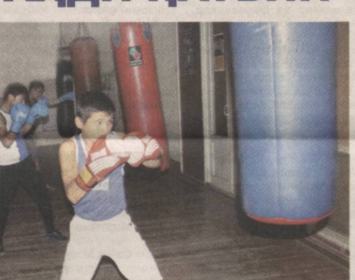
майдонларида Ватанимиз шарофтини муносиб ҳимоя қилиш келажақдаги энг катта орзуим.

Чирчиқдаги олимпия захиралари коллежнинг иқтидорли спортчилари 2014-2015 йилларда республиканинг бокс, белбоғи кураш, дзюдо, эшак эшиш, оғир атлетика, сузиш ва таэквандо бўйича терма жамоалари сафида ёшлар ўртасида ўтказилган Жаҳон ва Осиё чемпионатлари ҳамда Олимпиада ўйинларида учта олтин, ўн тўртта кумуш ва саккизта бронза медалларини қўлга киритгани бу ерда чинакам чемпионлар камол топаётганидан далолатдир.