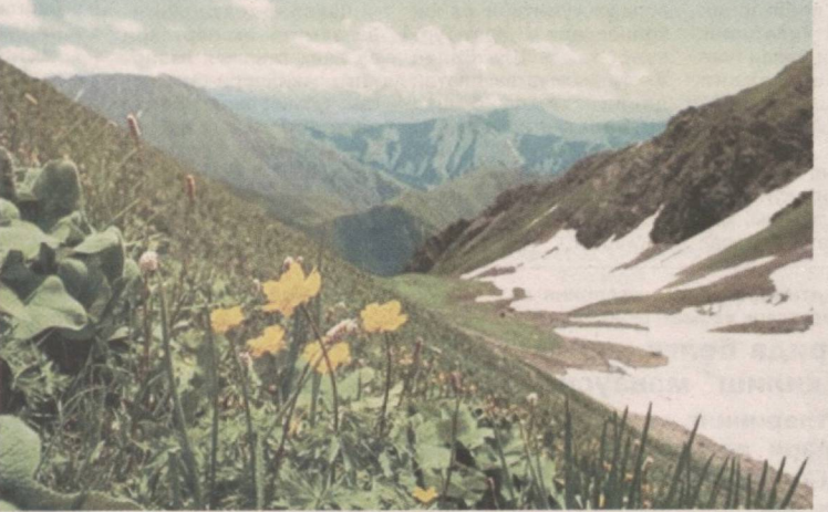
етказадиган қутлуг қадр кечаси, ҳар бир ёруғ кунининг эса ҳаётбахш Наврўз бўлишини хоҳлайди: Зулфу руҳсор ила қонинга мени етурсанг, ҳар тунунг қадр ўлбун ҳар кунинг бўлсун Наврўз! Ҳа, халқимиз эзгу юмуш, янгилик билан бошланган ҳар бир кунини Наврўз деб

нинг товуши, эндигина уйғониб, бедорликка шайланаётган одамнинг безовталиги бор. Зеро, майнинг сабо, юксалиб, тик келаётган кўёш шуурда ҳаракатта, меҳнатга таралдул уйғотади.