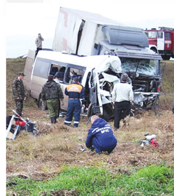
Орадан 5-10 дақиқа ўтгач, салониди яна бир ҳайдовчи ва

Қозоғистоннинг Жамбил туманида «Чимкент — Бишкек» йўналиши бўйлаб ҳаракатланаётган «Neoplan» русумли йўловчи автобуси йўл тўқнашиги билан тўқнашиб кетган.