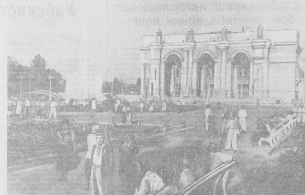
Театр майдони шаҳарнинг энг баҳаво жойларидан бирига айланди. Бу ерда ҳар кун и кеч қурун юзлаб кишилар сайр қиладилар. Осмонга отилиб турган ақолиб фонданан эсаётган салқин шабада уларга ҳузур бахш этади. Театр майдони шаҳар аҳолисининг энг севишли сайргоҳидир. Суратда: Театр майдони.

Пойтахтнинг Каганович, Ҳамза, Шота Руставели, Полиграфия, Педагогическая кўчалари ва Театр майдонининг қиёфаси ҳам табиб бўлмастик даражада ўзгармоқда. Биз бу йил республикамизнинг ўттиз йиллигини нишонлаймиз. Ана шу йиллар ичида Коммунистик партия ва Совет ҳўкуматининг раҳбарлиги остида, буюк рус халқининг ва кўп миллатли совет мамлакатимиздаги бошқа халқларнинг доимий қардошлик ёрдами натижасида республикамизнинг пойтахти — Тошкент Иттифоқимизнинг обод, кўркам, сановатли ва маданияти гуллаб-яшнаган шаҳарга, Шарқда / социализминг порлаб турган машаалга айланди.