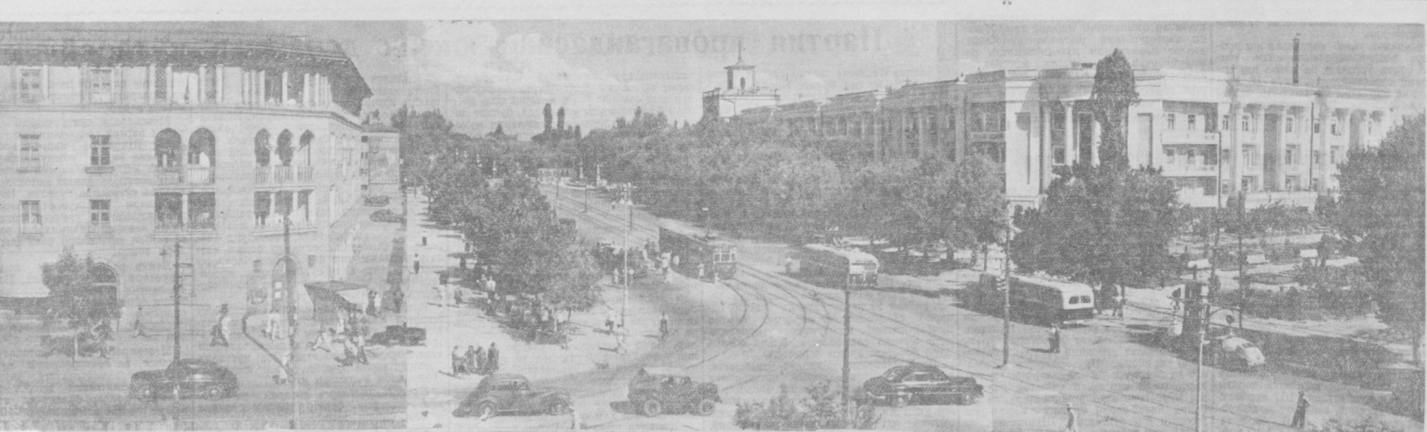
Алишер. Навоий проспекти Тошкентнинг энг обод ва энг гўзал проспектидир бирига айланмоқда. Унинг икки томонида совет архитекторларининг сўнги лойиҳалари асосида қурилган хашаматли бинолар қад кўтариб туради. Проспект ҳисига кўча сайин ҳўсн қўшилмоқда. Суратда: Алишер Навоий проспекти.