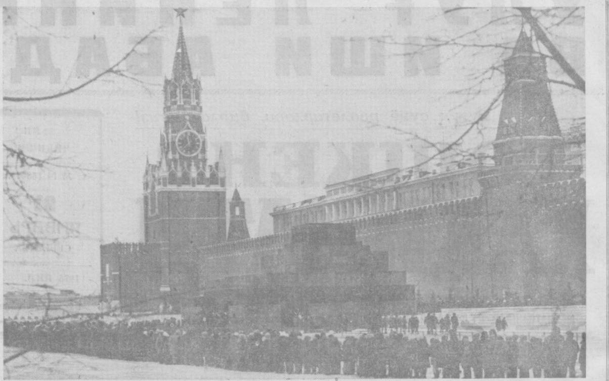
МОСКВА. Қизил майдон. Ленин мавзолейи.

Ильичнинг бутун ишида, бутун ижодида китобий билимлар эмас, балки ҳаётини унинг бутун мураккаб диалектика билан доҳийна ташувиши барқ уриб туради.