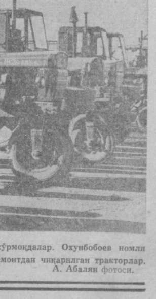
Ўрта Чирчиқ районининг ҳўжаликларини социалистик мусобәсәни кенг қўлоқ өйдириб, кўклам экиш кампаниясига пухта тайёргарлик кўрмоқдалар. Оқунбобоев номли колхоз механизаторлари ҳам самарали меҳнат қилиб, экиш агрегатларининг ҳаммасини масумга тахт қилиб қўйишди. Суратда: ремонтдан чиқарилган тракторлар.

1975 йил март ойининг биринчи ярмида иттифоқдош республикалар колхозлар кенгаши йиллигини қақришига қарор қилинди.