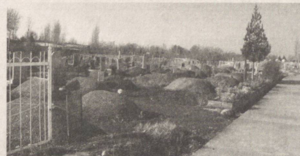
Қобил фарзанд қолдирганинг қабри ҳам обод...

Қурилма Европа ҳудудиде шу йилнинг мартдан бошлаб савдо-