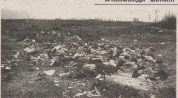
«Ўғлим, жигаргўшам, айтгинчи наҳот, Ачинмайди жонинг онанг ҳолига...»

Азизлар, шу харобат ости-да сизнинг ота-онангизни, яқинларингизни руҳи чирқираб ётмайтими? Кун келиб, вақт етиб, шу жойга барча-миз борамиз. Қайтар дунё, уларнинг холига ўзимиз ҳам тушамиз, албатта. Албатта,