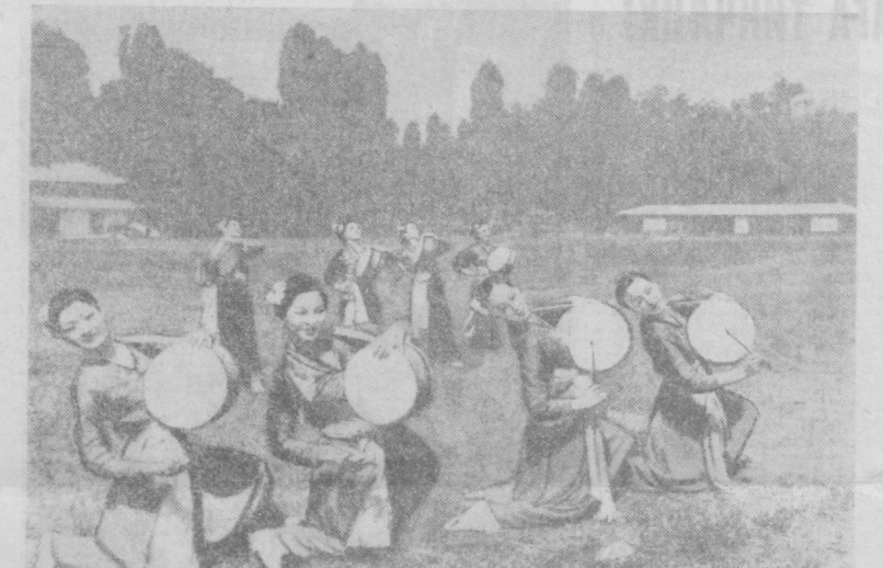
«Чен-чун» — Ўшанг дегани. Ўшангнинг эса қўшниси...