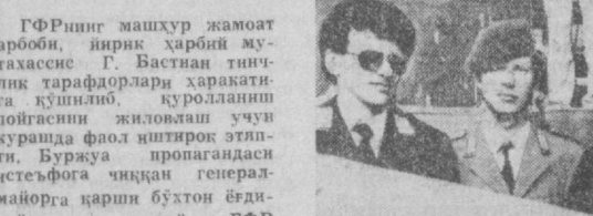
ГФРнинг машур жамоат аъзоси...