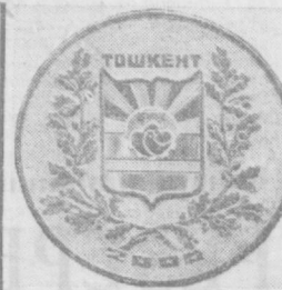
Ўзбекистон ССР Маданият ва маориф вазирлиги раиси...