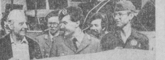
ГФРнинг машур жамоат аъзоси...