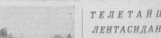
ГФРнинг машур жамоат аъзоси...