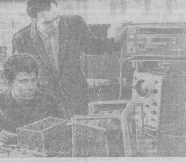
«Средазнергоц» е-т-мет-нинг пойтахтиндаги изотоп приборлар конструкторлик бюросида халқ хўжалиги учун зарур бўлган тўртинчи мосламалар тийёрламоқда.