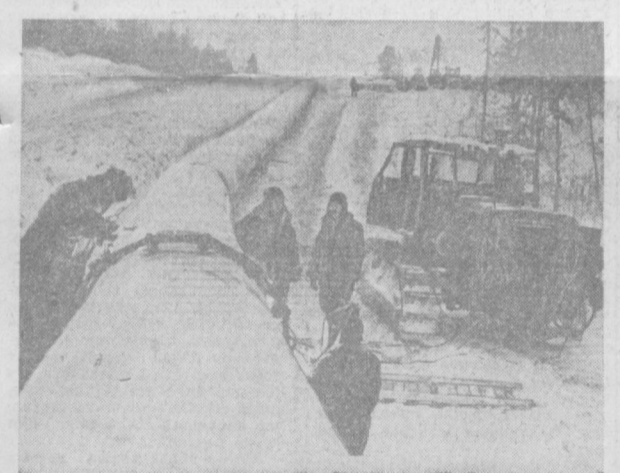
КОМИ АССР. «Шимол ёдуси» газопроводи қурилиши ниҳосин-га етай деб қолди. Бу улкан қурилиш Вуктыль конденсатланган газ ҳавасини марказ билан боғляпти. Суратда: «Шимол ёдуси» газопровод қурилишида. Ухта—Мезког участкасида пайванд ишлари олиб бориляпти.

ЎЗБЕКИСТОН ССР ОЛИЙ СОВЕТИ ПРЕЗИДИУМИНИНГ ФАРМОНИ РЕСПУБЛИКА МЕХНАТКАШЛАР ДЕПУТАТЛАРИ ОБЛАСТЬ, РАЙОН, ШАҲАР, ПОСЕЛКА, ҚИШЛОҚ ВА ОВУЛ СОВЕТЛАРИГА САЙЛОВ АТҚАЗИШ ТўҒРИСИДА