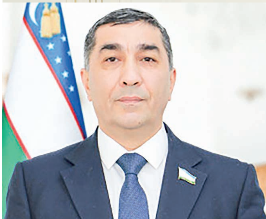
Адҳам ШОДМОНОВ, Олий Мажлис Қонунчилик палатаси депутати, О'зЛиДеР фракцияси аъзоси:

– Давлат бюджети мамлакатнинг даромадлари ва харажатлари рўйхатини ўзда ифодаловчи асосий молиявий ҳужжатдир. Шу боис охириги йилларда бюджет маблағларининг шаклланиши ва сарфланиши устидан парламент ва жамоатчилик назоратини кучайтиришга алоҳида эътибор қаратилмоқда.