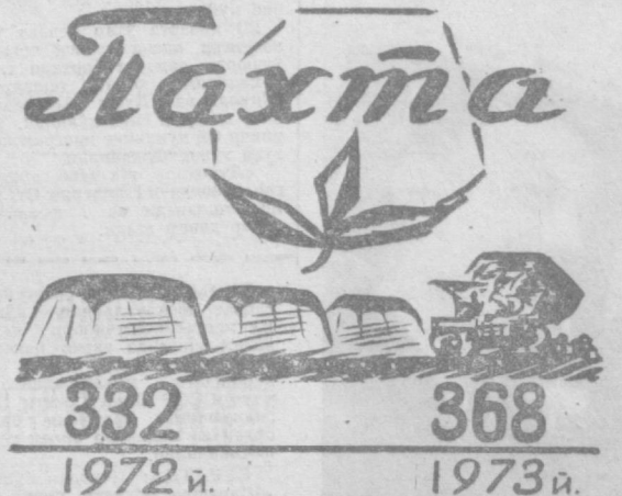
ПАХТА ЕТИШТИРИШНИНГ УСИШИ (планга нисбатан миң тонна ҳисобида).