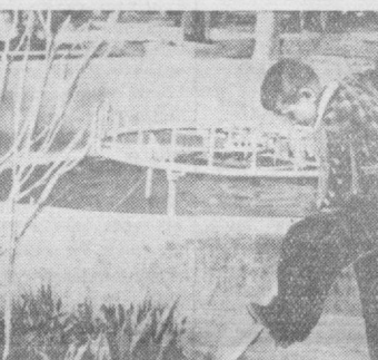
Боғдаги ёш дарахт кўчатларини болларнинг ўзлари парвартиш қиладилар.