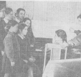
Боллар уйида тарбияланувчилар навбатдаги музика машғулотлари. Пионирлар янги куй янро отилмоқда.