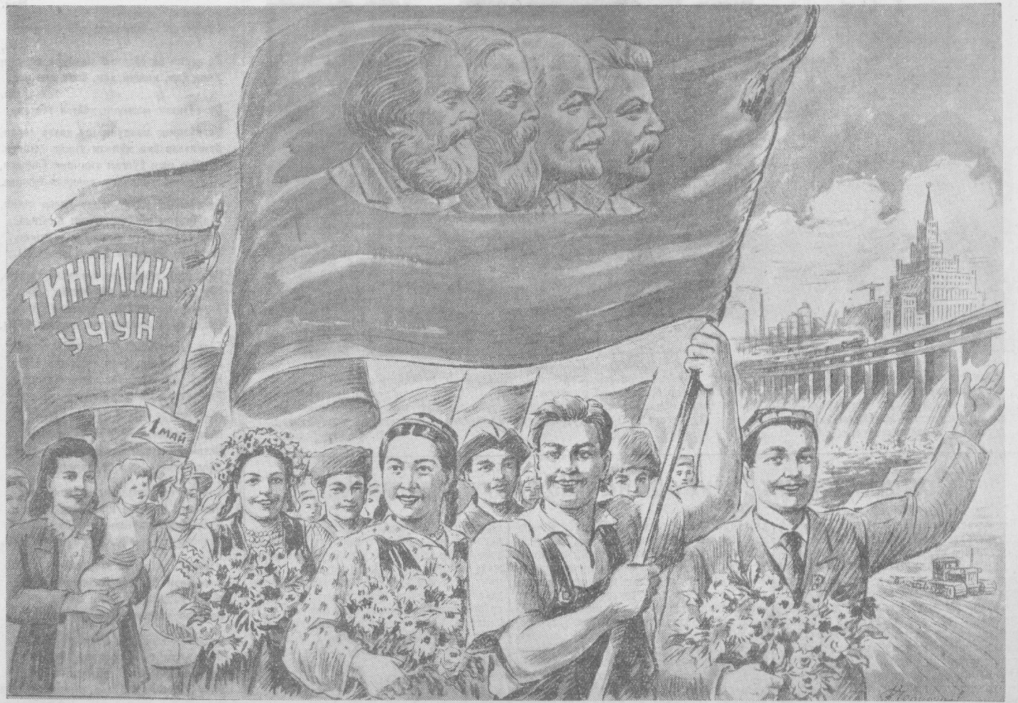
Н. Чернишев чизган расм

ССР Иттифоқи Мудофаа Министри Совет Иттифоқи Маршали Г. ЖУКОВ.