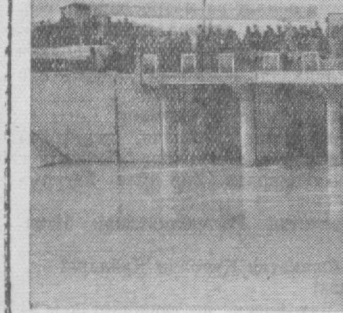
Суратда: бош тўғонининг умумий кўрилиши.

— Бугун бизлар учун тантанали бундир,— дейди ўртқ Усмонов.—