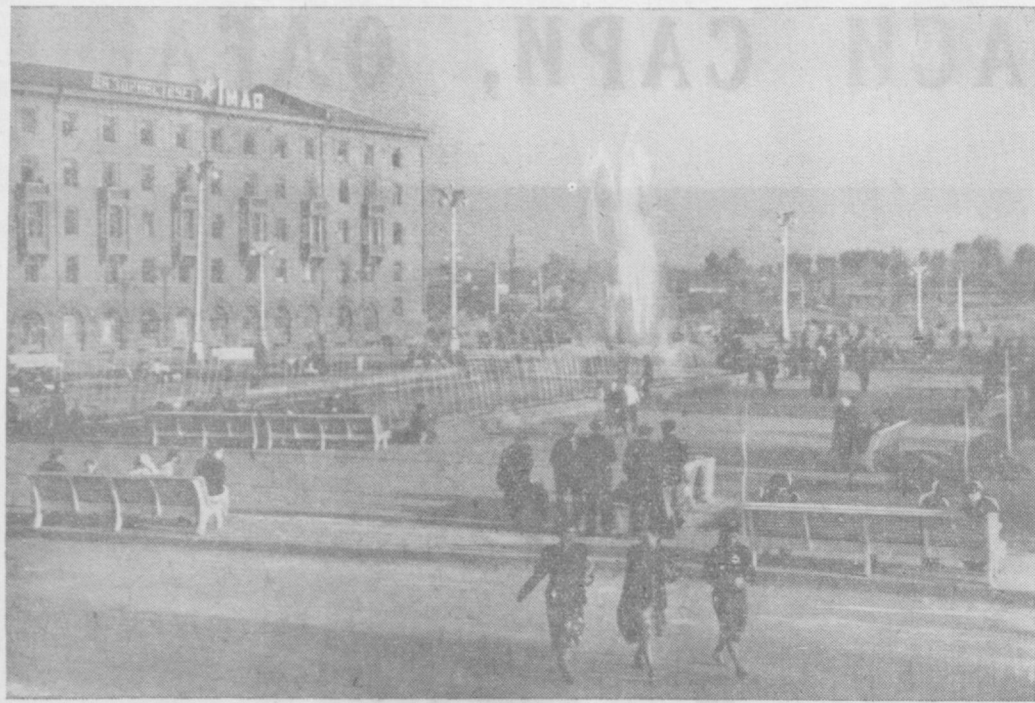
Суратда: комсомол майдони