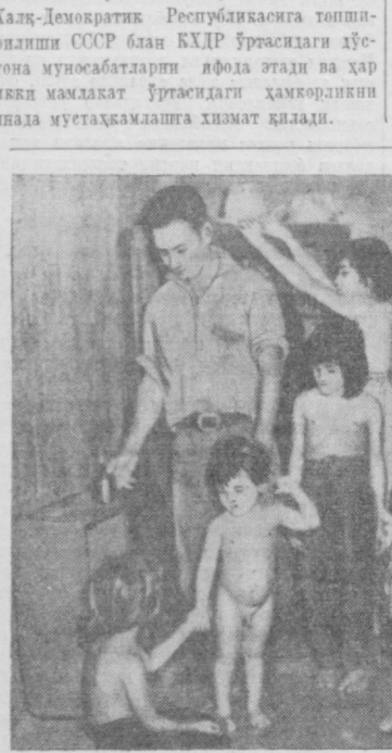
Куба ороли. Суратда: Кубали дехон олмаси.

Жамиятлардаги совет хиссасининг Корея Халқ-Демократик Республикасига топширилиши СССР билан КХДР ўртасидаги дўстона муносабатларни яқинроқ этди ва ҳар икки мамлакат ўртасидаги ҳамкорликни янада мустаҳкамлашга хизмат қилади.