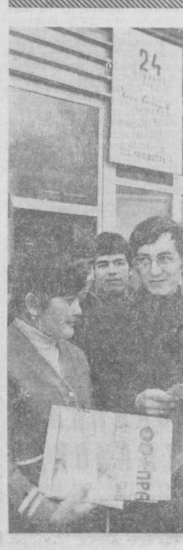
Тошкент шаҳридаги Октябр районининг 2/2 сайлов участкасида 100 нафардан кўпроқ пропагандачилар ва агитаторлар фаолият кўрсатишмоқда. Тошкент алоқа политехника техникумида жойлашган бу участка агитаторлари ҳамиша гажкум.

Ишлаб чиқариш ҳажми юзасидан белгилаган беш йиллик тошириқни 10 декабр-гача бажарилади ва ишлаб чиқариш ҳажминини ўстириш суръатлари юзасидан белгилаган беш йиллик план 30 процент ошириб адо этилади. Меҳнат умумдорлигини ошириш беш йиллик тошириғи маррасига 1980 йил 1 декабрда эришилди. Янги қувватларни ишга