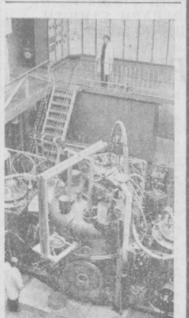
МОСКВА. И. В. Курчатова номидеги атом энергияси институтида «Огра-4» термоядро қурилмаси ишга тушрилди. Олимларнинг ҳисоб-ҳисобларида, бу қурилма воқеасида ҳам аввалги қилингандаги плазма олса бўлади. Лекин, ионлар температураси 2-3 марта ошади ва 150-200 миллион градусга етди. Суратда: «Огра-4» қурилмаси.