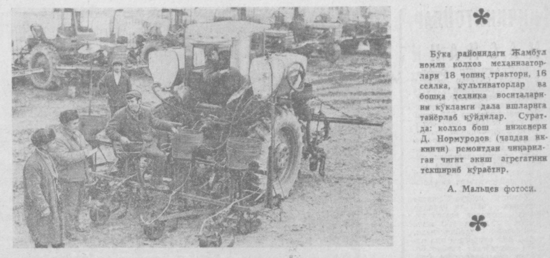
Бўша райондаги Жамбул номи колхоз механизаторлари 18 чопқ тректор, 16 селла, культиваторлар ва бошқа техника воситаларини қўллаган ҳақиқатга эришди.

Район икрония комитетидан «Ишга жойлаштириш бўлими» деб ёзилган хона елдида болалар имамони бўлиб туршилади.