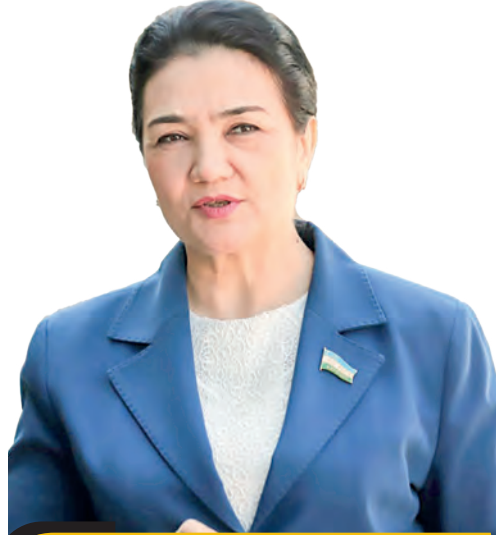
Мавлуда ХУЖАЕВА, Олий Мажлис Қонунчилик палатаси депутаты, O'zLiDeP Сиёсий Кенгаши Ижроия қўмитаси раисининг аёллар масалалари бўйича уринбосари

Ушбу лойиҳалар хотин-қизларнинг ижтимоий-сиёсий фаоллиги, жамиятдаги нуфузини кучайтириш, ташаббусларини қўллаб қувватлаш, янги билимларни