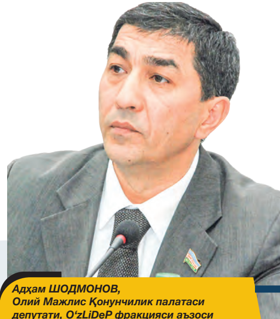
Адхам ШОДМОНОВ, Олий Мажлис Қонунчилик палатаси депутаты, O'zLiDeP фракцияси аъзоси

Бу байрам нафақат шу партияга мансуб инсонларнинг, балки бутун халқимизнинг қутлуғ