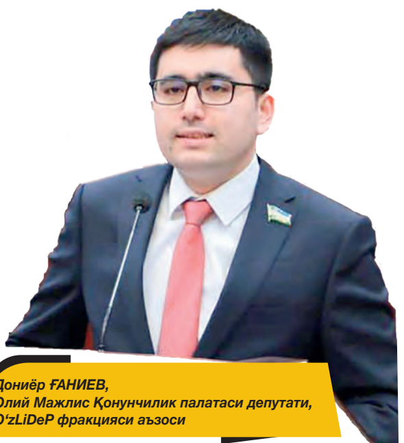
Дониёр ФАНИЕВ, Олий Мажлис Қонунчилик палатаси депутаты, O'zLiDeP фракцияси аъзоси

O'zLiDeP фаолияти Ватанга муҳаббат, юрт тарихи ва унинг кўп миллатли халқи анъаналарига ҳурмат каби қадр-иятларга асосланади. Барча депутатларимиз, тарафдорларимиз ва фаолларимизни ушбу қутлуғ сана муносабати билан чин юракдан табриклайм!