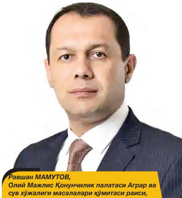
Равшан МАМУТОВ, Олий Мажлис Қонунчилик палатаси Аграр ва сув хўжалиги масалалари қўмитаси раиси, О'zLiDeP фракцияси аъзоси

Бугунги кунда қишлоқ хўжалигида 4 миллионга яқин ишчи-хизматчи банд. Юртдошларимизнинг ярми қишлоқ жойларида истиқомат қи-