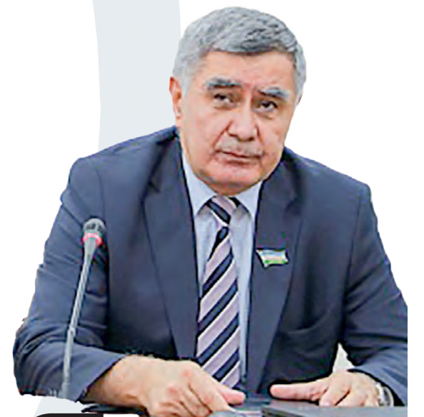
Эркин ЗОҲИДОВ, Олий Мажлис Қонунчилик палатаси депутаты, O'zLiDeP фракцияси аъзоси

Байрамингиз қутлуғ бўлсин азиз партиядошлар!