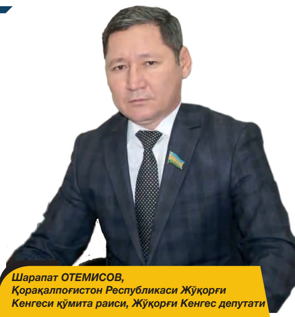
Шарапат ОТЕМИСОВ, Қорақалпоғистон Республикаси Жўқорғи Кенгеси қўмита раиси, Жўқорғи Кенгес депутати

Партия тизимида ишлар эканман, тадбиркор ва ишбилармонлар, фермерлар, барча соҳа вакиллари билан доимий мулоқотда бўлиб, уларни кўллаб-қувватлаш, қонуний манфаатларини ҳимоя қилишда катта тажриба мактабини кўрдим.