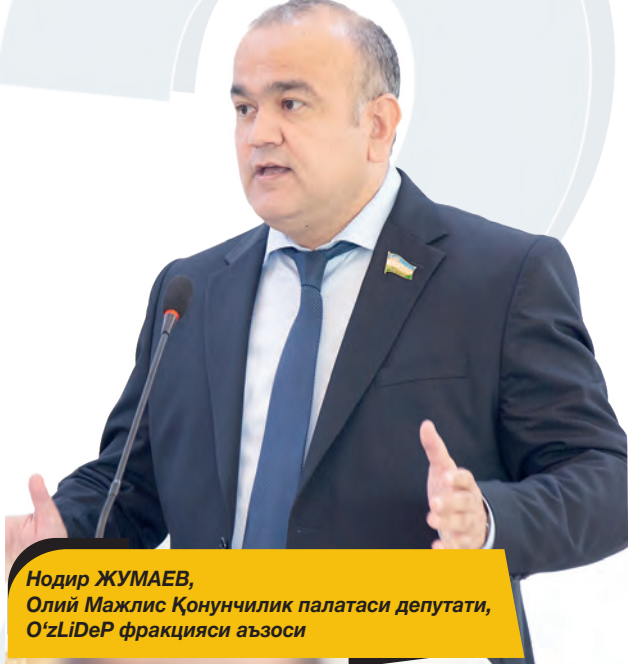
Нодир ЖУМАЕВ, Олий Мажлис Қонунчилик палатаси депутаты, O'zLiDeP фракцияси аъзоси

каси Президенти лавозимига 5 маротаба номзод кўрсатилган бўлса, барча сайловларда мутлақ кўпчилик овоз билан ғалаба