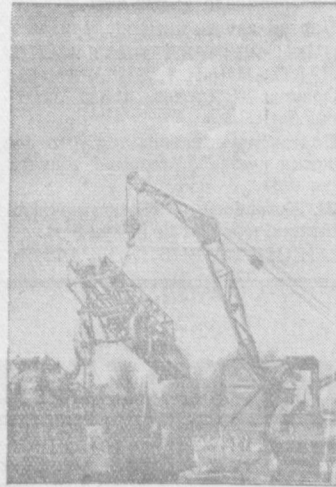
«Ташкентсельмаш» заводининг коллективини кўриқ ерлар учун «ЛТ—1» лентали транспортерлар тайёрлаш юзасидан берилган заказни мудатлидан илгари бажарди. Сурада: лентали транспортерлар кўриқ ерларга юбориш учун платформага остилмоқда.

Қ. ҒОФУРОВ, Қаниш район икромия комитетининг раиси.