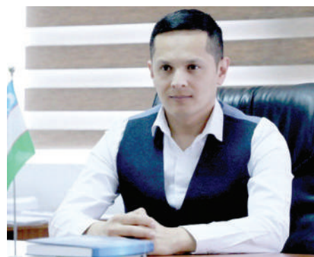
o'tkazish orqali ushbu makondagi xalqlarimizning yaqinlashuvi, demakdir.

Tan olish kerak, O'zbekiston ilgari surayotgan tashabbuslar mintaqa miqyosida ham, xalqaro miqyosida ham e'tirof etilgan va yuksak qadrlanadi. Xususan, davlatimiz rahbarining o'tgan yili MDH sammitida qadimiy Samarqand shahriga 2024-yilda "Hamdo'stlikning madaniyat poytaxti" maqomini berish borasida ilgari surgan taklifi Bishkek sammitida bir ovozdan qo'llab-quvvatlandi. Bu nimani anglatadi? Avvalo, kelgusi yil bahorda Samarqandda MDH davlatlarining madaniyat, san'at va kino haftaligi kabi keng ko'lami tadbirlarni