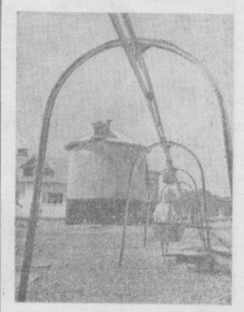
4-нчи «Вревский» наслчилик совхозини 1954 йил ва шу йилнинг 8 ойи ичида сут соғиб олишда юқори кўрсаткичларга эришиб, социалистик мусобақадароқиб чиқди. Натияжада совхоз КПСС Министрлар Советининг кўчма Қизил байроғини олишга муассар бўлди. Совхозда 11 ой давомида ҳарбир сигирдан 4378 килограмдан сут соғиб олинди. Совхозда бу йил 8 сиюс башинас курилиб, 6 тасига сиюс бостирилди. Суратда: янги сиюс башинас ва озуқаларини ташинида ёрдам беручи осма йўл.