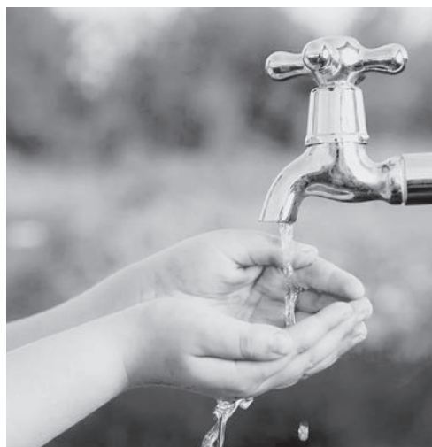
водой, а также улучшится ее снабжение для двух миллионов человек.

Кроме того, в 2024-2026 годах в нашей республике 1 млн 100 тысяч граждан будут обеспечены чистой питьевой