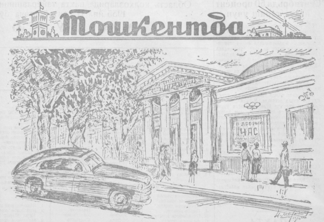
Яқинда Максим Горький номида рус давлат драма театрида кишки мавсум бошланди. Театр биноси бу йил қайта усқуналадиб капитал ремонт қилинди. Суратда: театр биносининг оиди томонидан кўриниши.