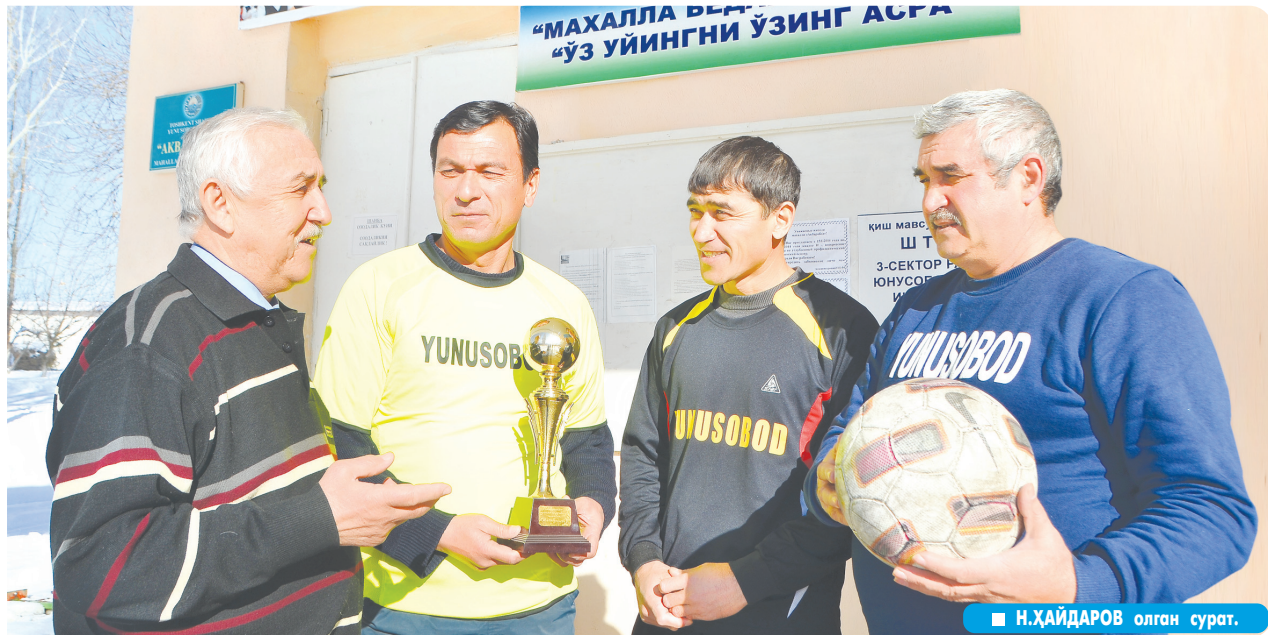
Н.ХАЙДАРОВ олган сурат.

Этиборли томони шундаки, бу ердаги нуронийлар доим ёшларга ўрнак. Улардан иборат «Юнусов» футбол жамоасининг ташкил топганига ҳам 10 йил бўлди. Унинг таркибига «Пахтакор» футбол жамоаси-