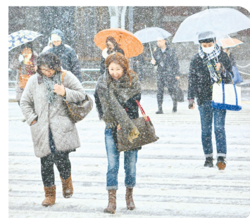
«NHK» телекомпанияси айрим ҳудудларда қорнинг

Японияда бир ярим кун давом этган тинимсиз қор ёғиши оқибатида 13 киши ҳаётдан кўз юмди, 1700 аҳоли жабрланди.