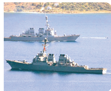
«Reuters»нинг «FARS» ахборот агентлиги хабарига таяниб маълум қилишчи, маъзур чора АҚШ ҳарбий денгиз кучларининг Форс

Эрон ҳукумати АҚШнинг Атлантика уммонидаги денгиз чегараларига бир неча ҳарбий кема юборади.