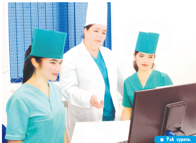
■ УЗА сурати.

Мустақилликнинг илк йилларидан бошлаб, муҳтарам Юртбошимиз раҳнамоликларида хотин-қизлар ва болалар саломатлигини таъминлашга алоҳида эътибор қаратилиб, эртаминг эгаларини соғлом ва баркамол этиб вояга етказиш йўлида ғамхўрлик кўрсатишмоқда. Ушбу йўналишдаги ишларнинг кўлами ва аҳамияти йил сайин ортиб бораётгани янада қувонарлидир.