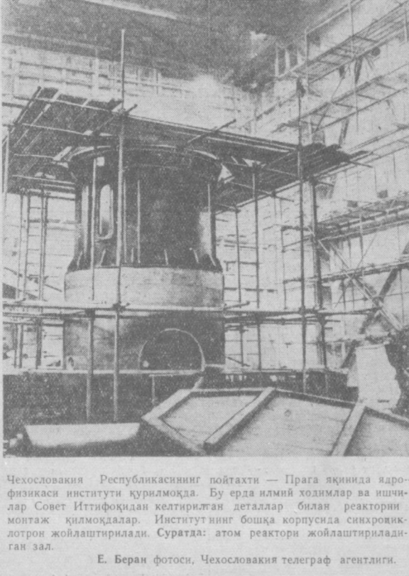
Чехословакия Республикасининг пойтахти — Прага ақинда ядро-физикаси институти қурилоқда. Бу ерда илмий ходимлар ва инжи-лар Совет Иттифоқидан келтирилган деталлар билан реакторни монтаж қилмоқдалар. Институтнинг бошқа корпусида синхрониз-лотрон жойлаштирилади. Суратда: атом реактори жойлаштирилган зал.

ҚОҲИРА, 31 декабрь. (ТАСС). Матбуотнинг билдиришича, Яман ҳукумати инглиз қўшинларининг Яман шаҳарлари ва қишлоқларига тўғрисида қуролли ҳужум қилма-ганлиги қарши Англия ҳукумати-га норозилик билдирган. Норозиликда, жумладан, 25 де-кабрда инглиз қўшинларининг Ката-ба шаҳрини ва бошқа бир қанча қишлоқларни ваҳшийларча ваёрой қилганлиги тўғрисида гапирилади. МЕН агентлигининг билдириши-ча, Яманнинг Қоҳирадаги вакили Абди-Раҳмон Абу Толиб Англиянинг Яман-га қарши ақинда қилган уруш ҳа-ракатлари тўғрисидаги меморандум-ни Бандунг конференциясида қат-нашган давлатларга юборган. У, Со-вет Иттифоқи, Югославия ва Поки-стоннинг Қоҳирадаги аъзолари ҳузу-рида бўлган ва Англиянинг Яманга қарши агрессияси тўғрисида уларга ўз ҳукумати номидан ахборот бер-ган. Агентликининг билдиришича, Яман ҳукумати Англия ҳукуматининг ала шу ҳаракатларига қарши БМТда но-розлик билдирган. Яман ҳукумати Англиянинг агрессиясини текшириш ва етказилган зарарларини аниқлаш учун халқаро комиссия тузишни БМТдан сурайдди.