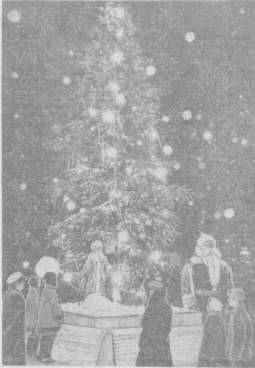
Алишер Навоий номидаги давлат опера ва баян театри майдонига ўрнатилган арча. Суратда: Янги Йил арчаси ёнида.