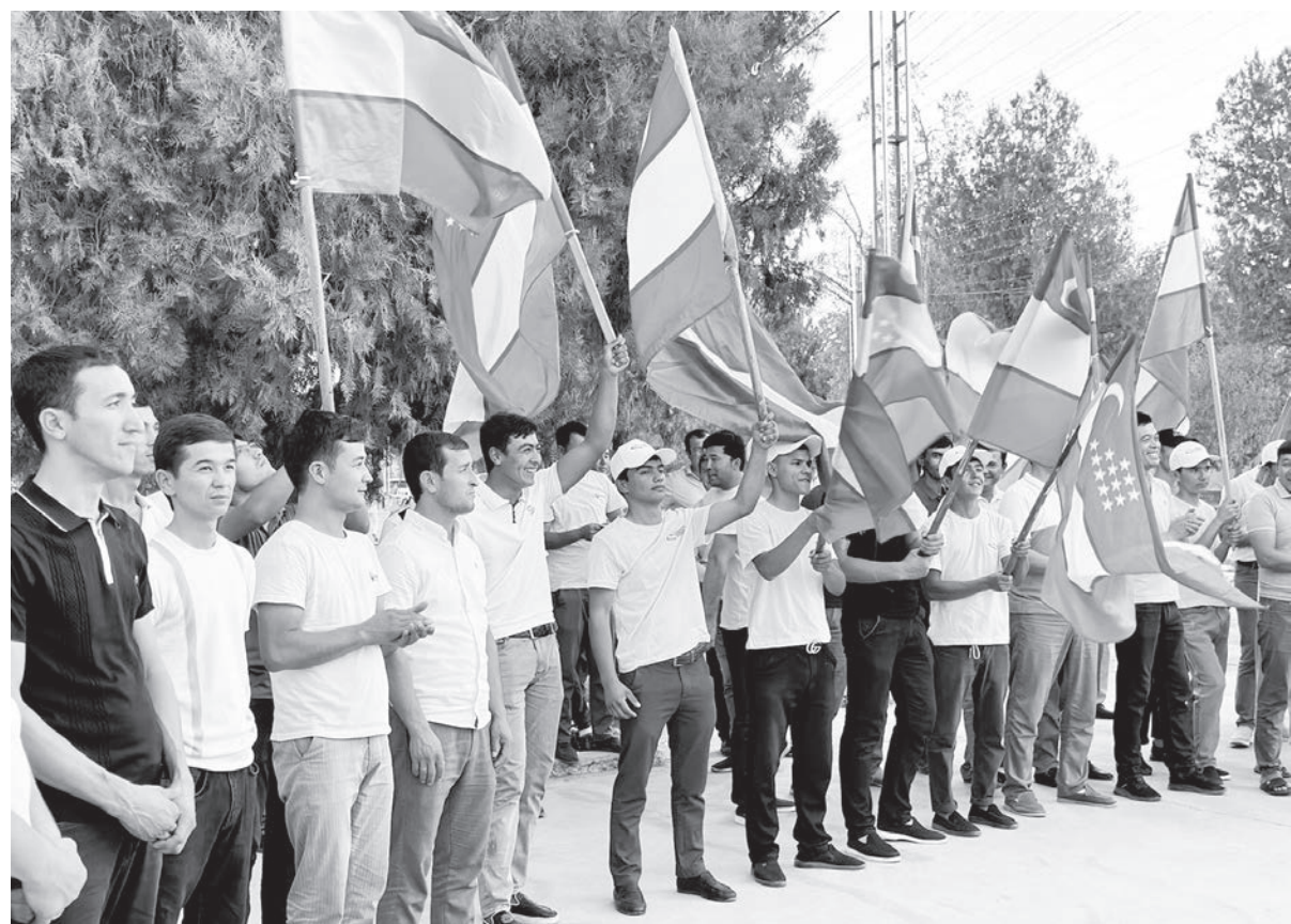
«Окончание. Начало на 1-й стр.»

В качестве приоритетной задачи задействуем также новые возможности для того, чтобы поднять на более высокий уровень молодежную политику, развитие спорта, образования и воспитания, науки, культуры и искусства».