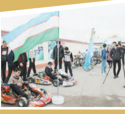
O‘zbekiston Respublikasi mudofaasiga ko‘maklashuvchi “Vatanparvar” tashkiloti matbuot xizmati