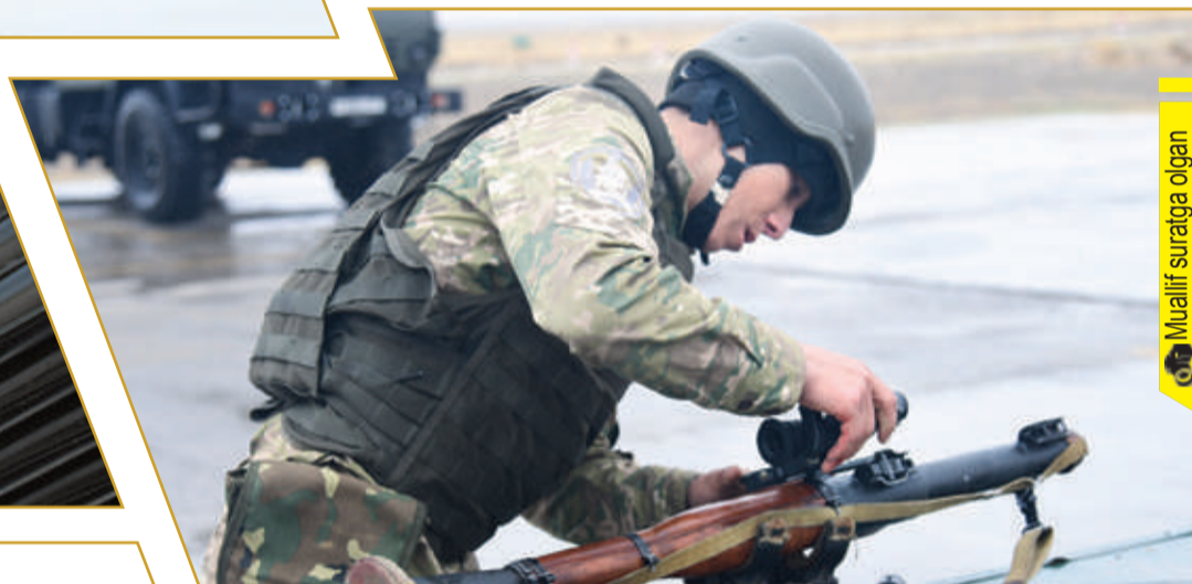
Muallif surata olgan