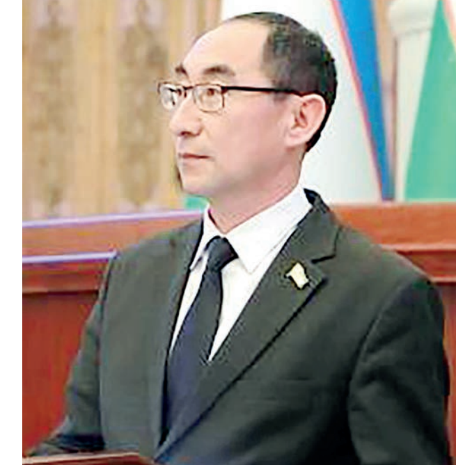
Тўлқинжон КАРИМОВ, Олий Мажлис Қонунчилик палатаси депутаты, О'зЛиДеР фракцияси аъзоси

Шунингдек, керакки, миллий тараққиётга эришишнинг ягона тўғри йўли – демократик давлат ва фуқаролик жамияти қуриш йўли ҳисобланади. Бу ғоя Конституциямизнинг асосий ғояси саналади.