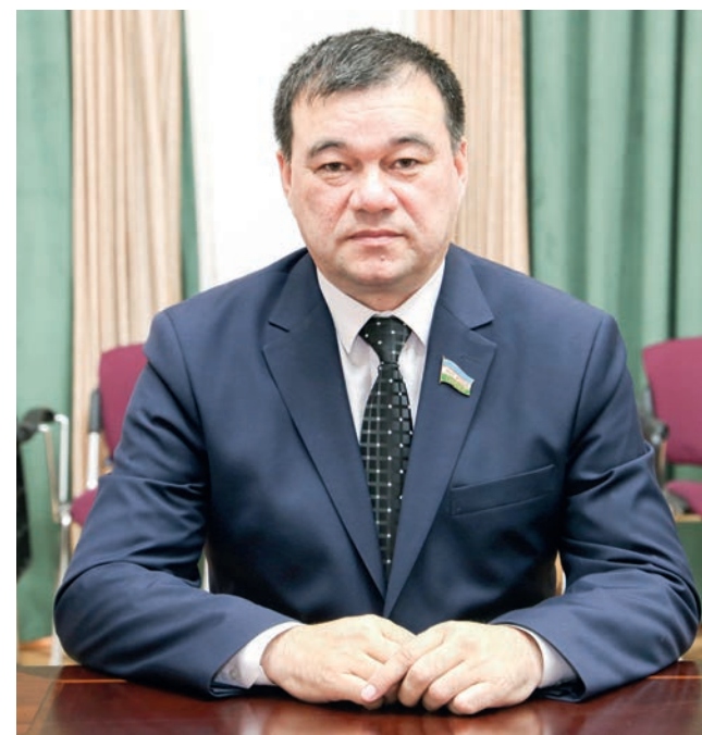
Зафар ХУДОЙБЕРДИЕВ, Олий Мажлис Қонунчилик палатаси депутаты, О'зЛиДеР фракцияси аъзоси

Умуман олганда, Конституциямиздаги барча ўзгартиш ва янги нормалар авваламбор мамлакатимизнинг янада ривожланишига, халқимиз фаровонлигига хизмат қилади.