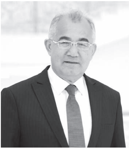
Акмал Саидов. Первый заместитель Спикера Законодательной палаты Олий Мажлиса Республики Узбекистан.