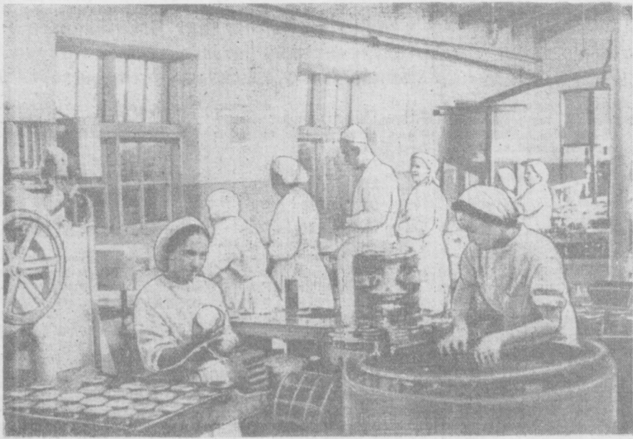
Янгийўл шахридаги консерва заводининг коллективини ўтган йилги планга қўшимча равишда уч миллион банка консерва маҳсулотлари тайёрлаб бериб, олган мажбуриятини бажарди. Завод ишчилари январь ойи биринчи ярми планыни муддатидан иски кун олдин бажардилар. Суратда: мена-сабабот ҳеҳида консерваларни конвейердан тушириш пайти.