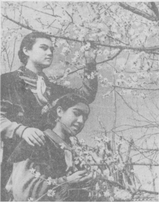
Уруқ туллади.