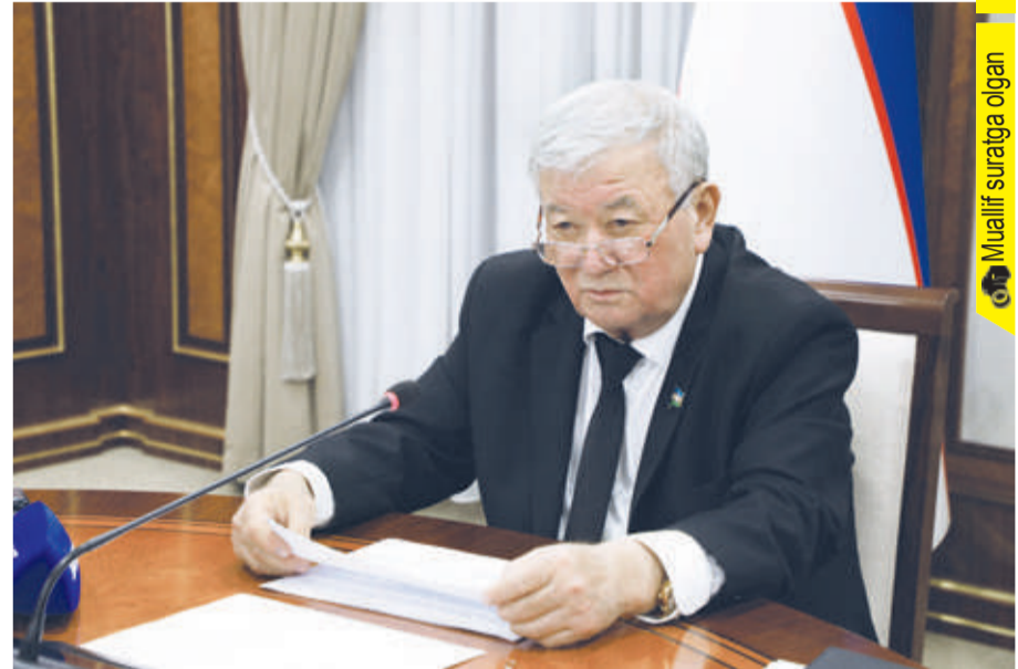
Muallif sur'atga olgan

Oliy Majlis Senatining Mudofaa va xavfsizlik masalalari qo'mitasida dolzarb mavzularga bag'ishlangan yig'ilish bo'lib o'tdi. Unda Senatning navbatdagi yalpi majlisi kun tartibiga kiritilishi rejalashtirilgan masalalar dastlabki tarzda ko'rib chiqildi.