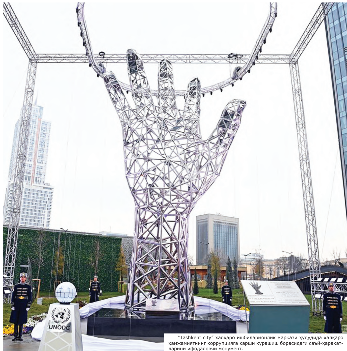
"Tashkent city" халқаро ишбилармонлик маркази ҳудудида халқаро ҳамжамиятнинг коррупцияга қарши курашиш борасидаги саъй-ҳаракатларини ифодаловчи монумент.