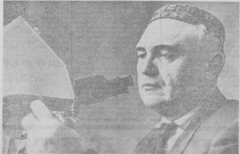
Мана бу суратда изотоп лабораториясининг бошлиғи, биология фанлари доктори, профессор В. А. Струниқовни кўриб турибсиз.

ҳалари борган сари комплекс механизациялашяпти. Лекин шу пайтгача пиллачилардан ишлар асосан қўлда бажариларди. Бу бўлим илмий ходимларининг бир неча йиллик самарали меҳнати тўғрисида бундан бун пиллачиларимизнинг қўлда қилладиган ишларини машиналар қилади.