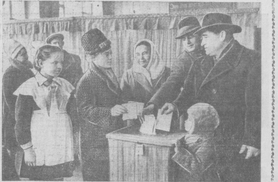
Суратларда: 1. Фрунзе районидаги 343-сайлов участкасида ёш сайловчилар халқ номзодлари учун овоз беришмоқда. 2. Куйбисhev районидagi 79-сайлов участкасида овоз бериш пайти.

Партия-ҳўжалик активни йилги, шунинг қатнашчилари 1965 йилги социалистик мажбуриятларни қабул қилдилар ва Велорусия, Ленинград, Иваново энергетикасини мусобақа- га чақирдилар. (ЎЗАТ).