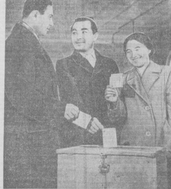
Суратда: Фрунзе районидagi 342-сайлов участкасида коммунистлар билан партиячилар аиралмас блокнинг номзодлари учун овоз бериш пайти.