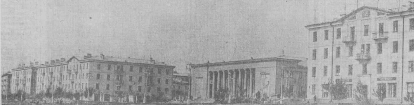
160-қурилиш трести бинокорлари қурилиш-монтаж ишлари суръатига-суръат қўшмоқдалар. Бинокорлар қўли билан қурилган кўркам кварталларда чирчиқчилар қўли билан қўлдан қўн ўтказиб, бахтиёр ҳаёт кечирмоқдалар. Шаҳарнинг Тинчлик кўчасида қад кўтарган суратдаги биноларга ҳам трест коллективини меҳнатиди енгган. Р. Шамсуiddinov фотоси. (ЎзТАГ фотохроникаси).

Ихтисослаштириш дарҳол ўз самарасини кўрсатди. Ўтган йили «Чирчиқсельмаш» бошқармаси республикамиз катта химия саноатини раванга топтириш йўлида ақойиб галабаларини қўлга киритди. Бошқарма бинокорлари қўли билан электротехника комбинатида қарбамид цехи бўвуд этилди. Цех ишлаб чиқараётган миңлаб тонна ер хамир туруши пахтакорлар ҳосили ва чорваларлар маҳсулотига баранга киритмоқда. 225-УНР коллективини ҳам «Узбекинмаш», «Чирчиқсельмаш» заводлари, Ўзбекистон иссиққа чидамли ва қирин эрийдиган металл комбинатида илгир-илги қўвватларини фойдаланишга топширди. Йилдан ташқари «Чирчиқсельмаш» бошқармаси бинокорлар эришган