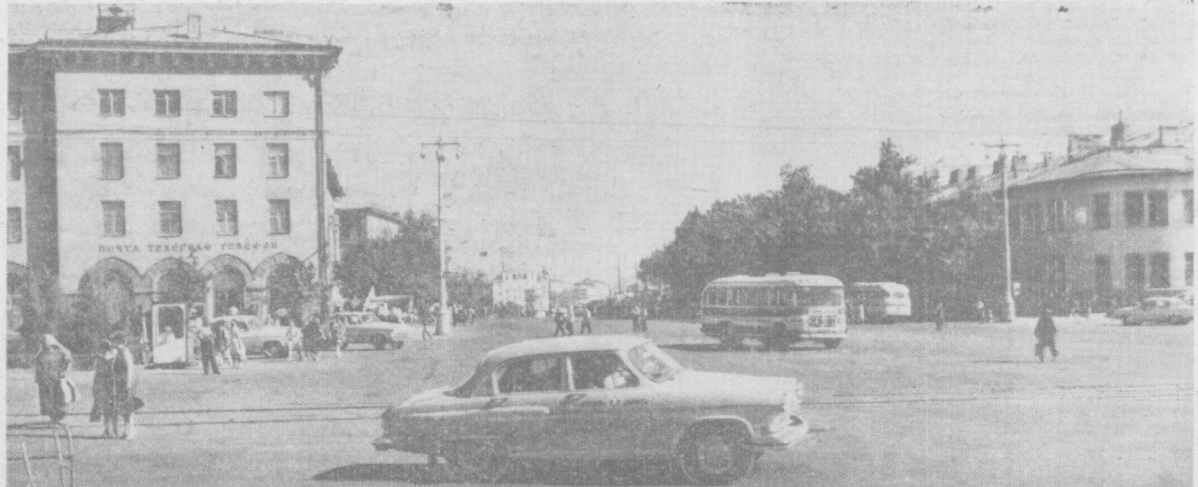
БУГУНГИ ТОШКЕНТ.