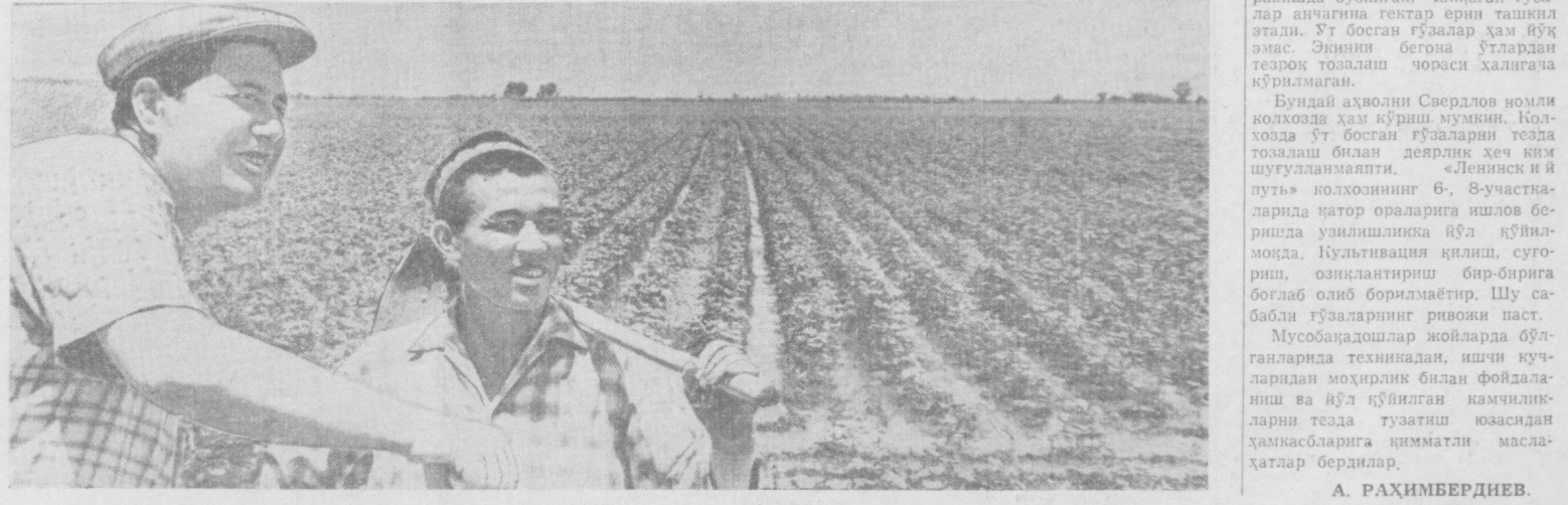
Бектемирдаги Охунбобоев номи қолхозининг меҳр деҳқонлари гўзани меҳр билан сугормоқдалар.

Совет Иттифоқи ҳукуматининг таклифига буюнсан, Швеция бош министри Таге Эрландер вилит билан 10 июньда рафинаси билан бирга Москвага келди. (ТАСС).