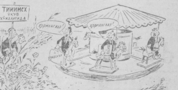
Институт раҳбарлари: — Ҳа деб қўнчаберманлар, албатта, ердан берамиз. М. Воробейчиков чизган расм.